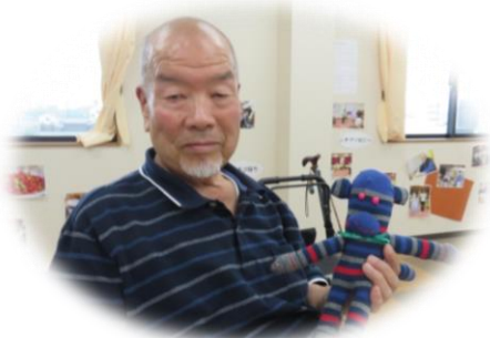
・手芸教室『手作りクラブシュシュ』