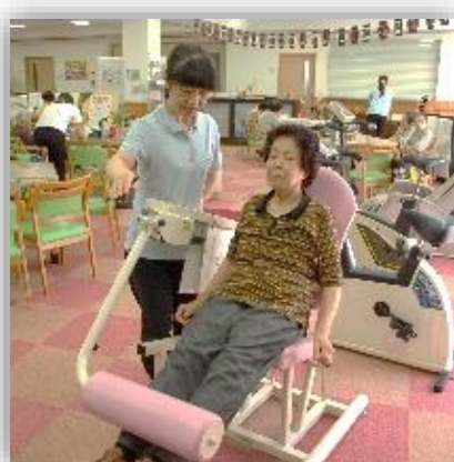
・マシーントレーニ