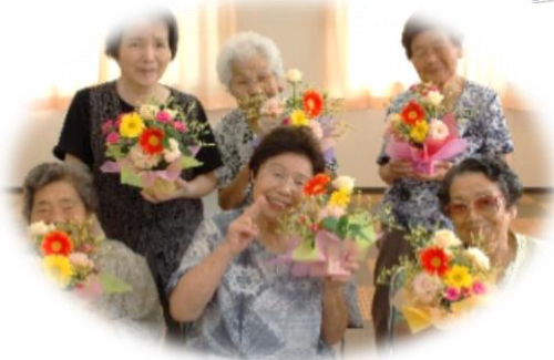
・フラワーアレンジメント